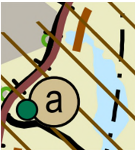
Kuva 3. Ote maakuntakaavan yhdistelmäkartasta.

Suunnittelualueella on voimassa Keski-Suomen maakuntakaava (hyväksytty 1.12.2017 §41, päätös voimaantulosta 26.1.2018 §6, lainvoimainen 28.1.2020) sekä sitä hyvinvoinnin aluerakenteen ja seudullisesti merkittävän tuulivoimatuotannon ja liikenteen osalta täydentävä maakuntakaavan päivitys Keski-Suomen maakuntakaava 2040 (hyväksytty 8.12.2023 §21, päätös voimaantulosta 23.2.2024 §11, voimaantulo kuultettu 19.3.2024). Keski-Suomen maakuntakaava 2040 päivittää voimassa olevaa maakuntakaavaa rullaavan maakuntakaavoituksen periaatteiden mukaisesti kertyneet muutostarpeet huomioiden. Maakuntakaava 2040 muuttaa ja täydentää voimassa olevaa maakuntakaavaa em. teemojen osalta, muilta osin Keski-Suomen maakuntakaava jää voimaan sellaisenaan.