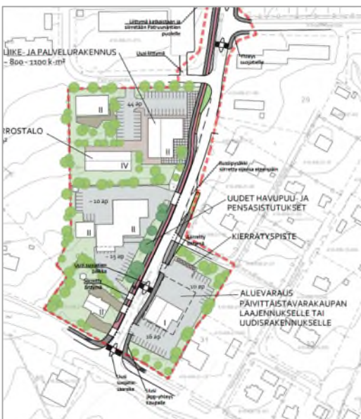
Kuva 6. Ote Vihtavuoren Haaviston maankäytön ja liikenteen visiosta. (Ramboll Oy, 2020).

Vihtavuoren taajaman keskustan läpi kulkevalle Haavistontielle on tehty kehittämissuunnitelma, jonka tavoitteiksi on määritelty muun muassa yhtenäisen ja loogisen liikenneympäristön luominen, kestävien liikkumis-muotojen (kävely ja pyöräily) käytön edistäminen, joukkoliikenteen ja sen käyttäjien olosuhteiden parantaminen, alueen taajamakuvan ja viihtyisyyden parantaminen sekä vetovoiman lisääminen maankäyttöä kehittämällä ja tiivistämällä. Suunnitelman taustalla on ollut Laukaan kunnan vuonna 2017 laadittu liikenneturvalli-suussuunnitelma, Haavistontien varressa sijaitsevan vastikään valmistuneen uuden koulukeskuksen suunnitelmat sekä kuntalaisille suunnatun karttapalauteky-selyn tulokset. Haavistontien liikenteellä on vaikutusta myös suunnittelualueeseen.