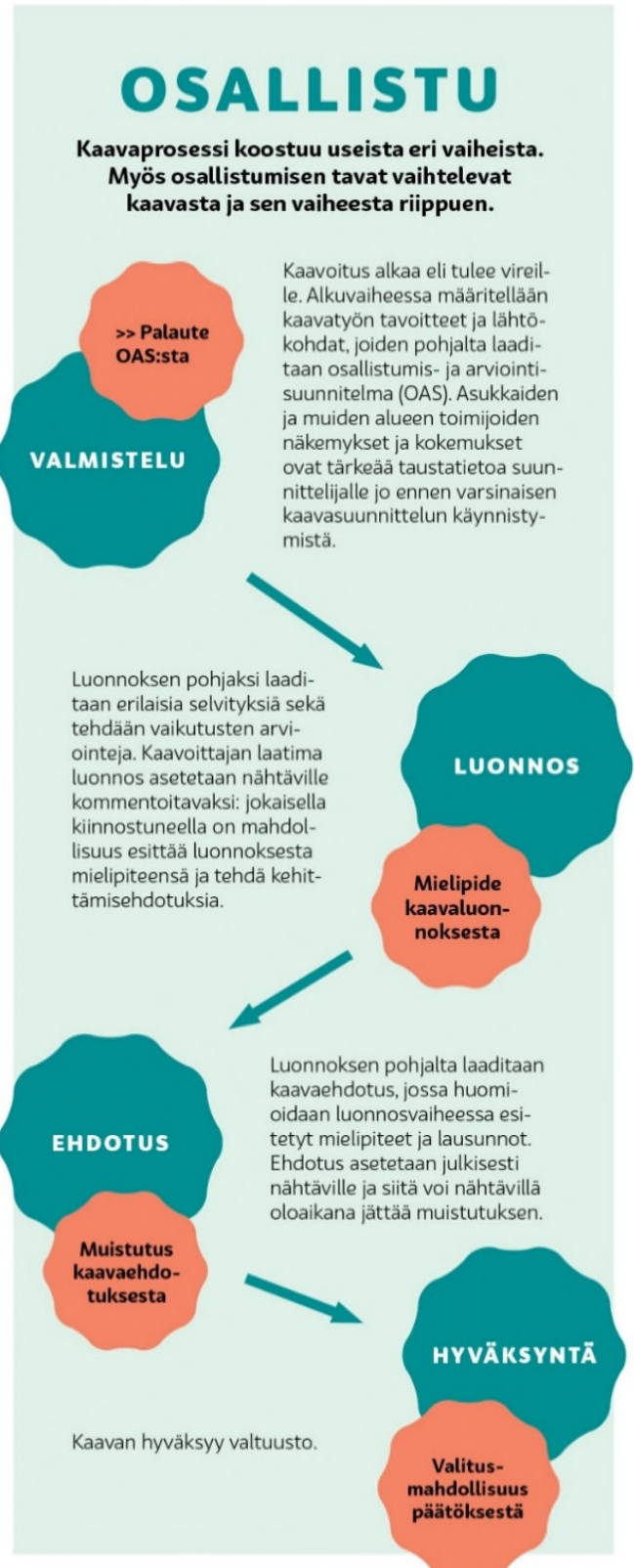
Kuva 7. Kaavaprosessi ja osallistumisen tavat sen eri vaiheissa.