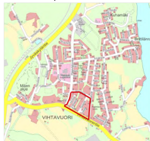
Kuva 1. Suunnittelualueen sijainti.

410-406-21-36 Kanto, 410-406-21-92 Räsälä, 410-406-21-37 Rauhala, 410-406-21-28 Lehtola, 410-406-21-27 Koivula, 410-406-21-26 Vesala, 410-406-21-192 Vihtalähde, 410-406-21-193 Kuhalähde, 410-406-21-13 Kuhalehto, 410-406-13-102 Savelan puisto, 410-406-13-101 Pilvelä, 410-406-13-69 Senilä, 410-406-13-235 Peltovainio, 410-406-13-245 Savela, 410-406-13-244 Villa Kuhalehto, 410-406-13-104 Mäenpää, 410-406-13-105 R 3, 410-406-13-85 Kanto, 410-406-13-84 Välimaa, 410-406-13-83 Peltola, 410-406-13-82 Rukoushuone, 410-406-13-81 Sirkkala, 410-406-13-103 Ainola, 410-406-13-71 Nurmela, 410-406-13-38 R 1, 410-406-13-234 Pokela, 410-406-13-233 Viljamäki, 410-406-13-232 Kauppi, 410-406-13-207 Purola, 410-406-13-206 Margala, 410-406-13-167 Ahlbacka, 410-406-13-43 R 6, 410-406-13-87 Kuusela, 410-406-13-88 Toukola, 410-406-13-45 R 8, 410-406-13-198 Ruusula, 410-406-13-197 Ruusula 2, 410-406-13-73 Kerttula, 410-406-13-74 R 10, 410-406-13-48 R 11, 410-406-13-49 R 12, 410-406-13-138 Vihtalaakso, 410-406-13-161 Ollila, 410-406-13-50 R 13, 410-406-13-110 Peltola, 410-406-13-162 R. 14, 410-406-13-163 R. 15, 410-406-13-106 Palola, 410-406-13-116 Kulmala ja 410-406-21-93 Komu.