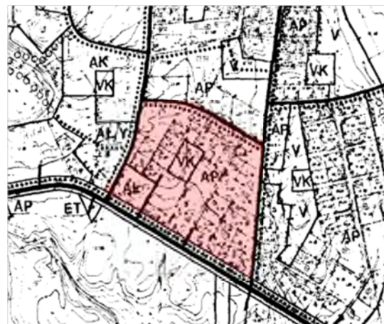
Kuva 4. Ote oikeusvaikutuksettomasta Vihtavuoren osayleiskaavasta. Suunnittelualue on merkitty kuvan punaisella.

Suunnittelualueella on voimassa oikeusvaikutuksen Vihtavuoren osayleiskaava, joka on hyväksytty kunnanvaltuustossa 18.5.1987 §77. Osayleiskaavassa suunnittelualueelle sijoittuu asuinpientalojen aluetta (AP) , asuin-, liike- ja toimistorakennusten aluetta (AL) sekä leikkikenttä (VK) . Vihtavuorentie on osoitettu alueellisenä pääväylänä . Alueelliselle pääväylälle on osoitettu ohjeelliset liittymät.