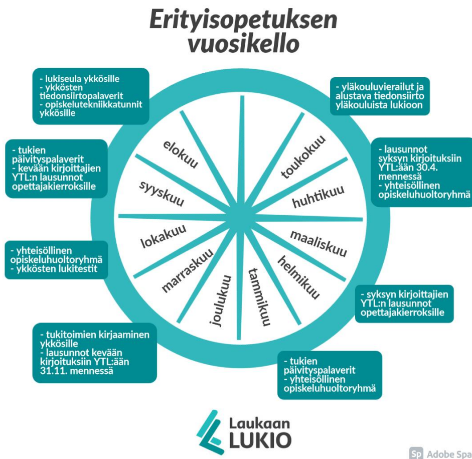
Laukaan lukion erityisopetuksen vuosikello

Opiskeluhuollon moniammatillinen yhteistyö on kuvattu opetuksen järjestäjän opiskeluhoitosuunnitelmassa .