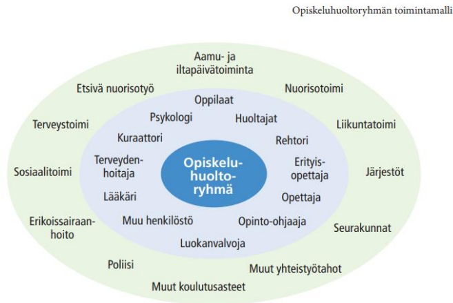
Kuvio 3. Esimerkki opiskeluhoitoryhmän kokoonpanosta (K. Laitinen, 2014).

edustaja, mahdolliset hanketyöntekijät ja koulun neopsyttsemppari(t). Kokouksiin kutsutaan tarpeen mukaan muita sidosryhmiä.