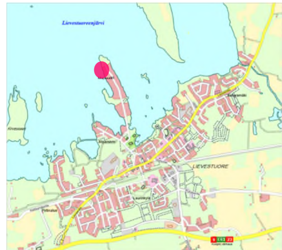
Kuva 1. Suunnittelualueen sijainti punaisella ympyrällä.

1,26 ha, mutta varsinaisen muutoksen alaisen alueen ala on noin 5800 m 2 .