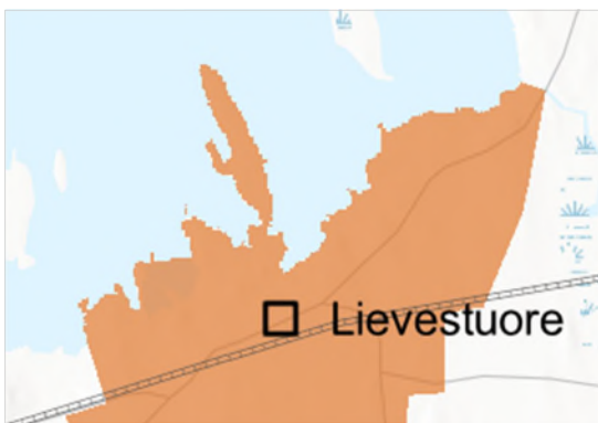
Kuva 6. Ote MAL-kehityskuvan pääkartasta (Jyväskylän kaupunkiseudun MAL-paikkatietoalusta, 6.8.2025).

Jyväskylän seudun MAL-kehityskuva on kahdeksan kunnan yhteinen, karttapohjainen pitkän aikavälin suunnitelma alueen yhdyskuntarakenteesta, viherrakenteesta ja liikennejärjestelmästä. MAL-kehityskuva hyväksyttiin seudun kuntien kunnanvaltuustoissa vuoden 2023 alussa. MAL-kehityskuvassa Lievestuore on osoitettu paikalliskeskuksena (musta neliö), joka sijoittuu Vyöhykkeelle II: Täydentyvä taajama (oranssi).