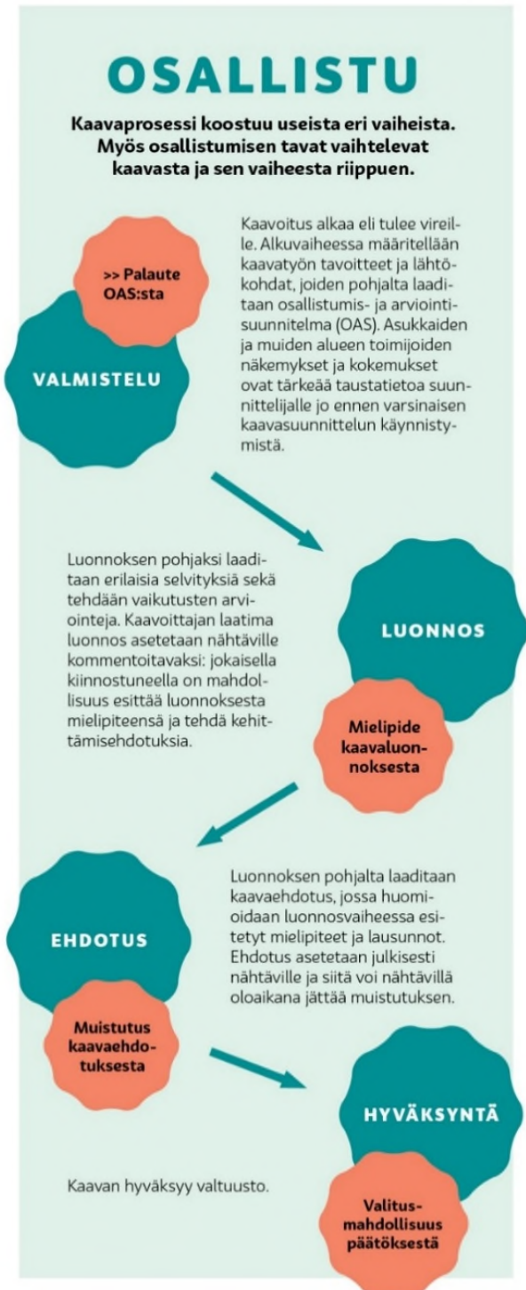
Kuva 10. Kaavaprosessi ja osallistumisen tavat sen eri vaiheissa.

Kunnan tulee järjestää osallisille mahdollisuus osallistua kaavan valmisteluun, arvioida kaavoituksen vaikutuksia ja lausua kirjallisesti tai suullisesti mielipiteensä asiasta (AKL 62 §).