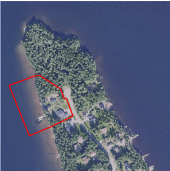
Kuva 3. Ote Maanmittauslaitoksen ilmakuvasta. Suunnittelualueen raja on merkitty kuvaan punaisella.