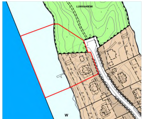
Kuva 9. Ote ajantasa-asemakaavasta.

Suunnittelualueella on voimassa asemakaava Majasaari, Lievestuoreen kylä, rakennuskaava (kaavatunnus 410 19881027L), joka on hyväksytty 12.6.1987 ja lääninhallitus vahvistanut 27.10.1988 (RA-1155).