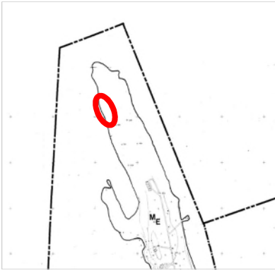
Kuva 8. Ote oikeusvaikutuksettomasta Lievestuoreen osa-alue III yleiskaavasta.

Suunnittelualueella ei ole voimassa oikeusvaikutteista yleiskaavaa. Alueelle sijoittuu oikeusvaikutuksen Lievestuoreen osayleiskaava, osa-alue III , joka on hyväksytty valtuustossa 26.10.1987 §145. Siinä suunnittelualue sijoittuu erityisselvitys-alueelle M E .