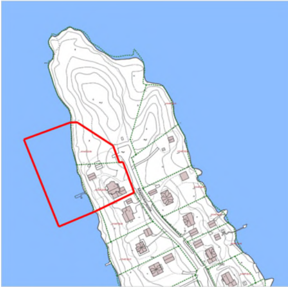
Kuva 2. Maastokarttaote. Suunnittelualueen raja on merkitty kuvaan punaisella.