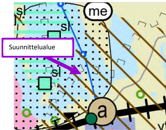
Kuva 5. Ote voimassa olevasta Keski-Suomen maakuntakaavayhdistelmästä suunnittelualueen kohdalta.

Suunnittelualueella on voimassa Keski-Suomen maakuntakaava (hyväksytty 1.12.2017 §41, päätös voimaantulosta 26.1.2018 §6, lainvoimainen 28.1.2020) sekä sitä hyvinvoinnin aluerakenteen ja seudullisesti merkittävän tuulivoimatuotannon ja liikenteen osalta täydentävä maakuntakaavan päivitys Keski-Suomen maakuntakaava 2040 (hyväksytty 8.12.2023 §21, päätös voimaantulosta 23.2.2024 §11, voimaantulo kuulutettu 19.3.2024, lainvoimainen 1.10.2025). Maakuntakaava 2040 muuttaa ja täydentää voimassa olevaa maakuntakaavaa em. teemojen osalta, muilta osin Keski-Suomen maakuntakaava jää voimaan sellaisenaan.