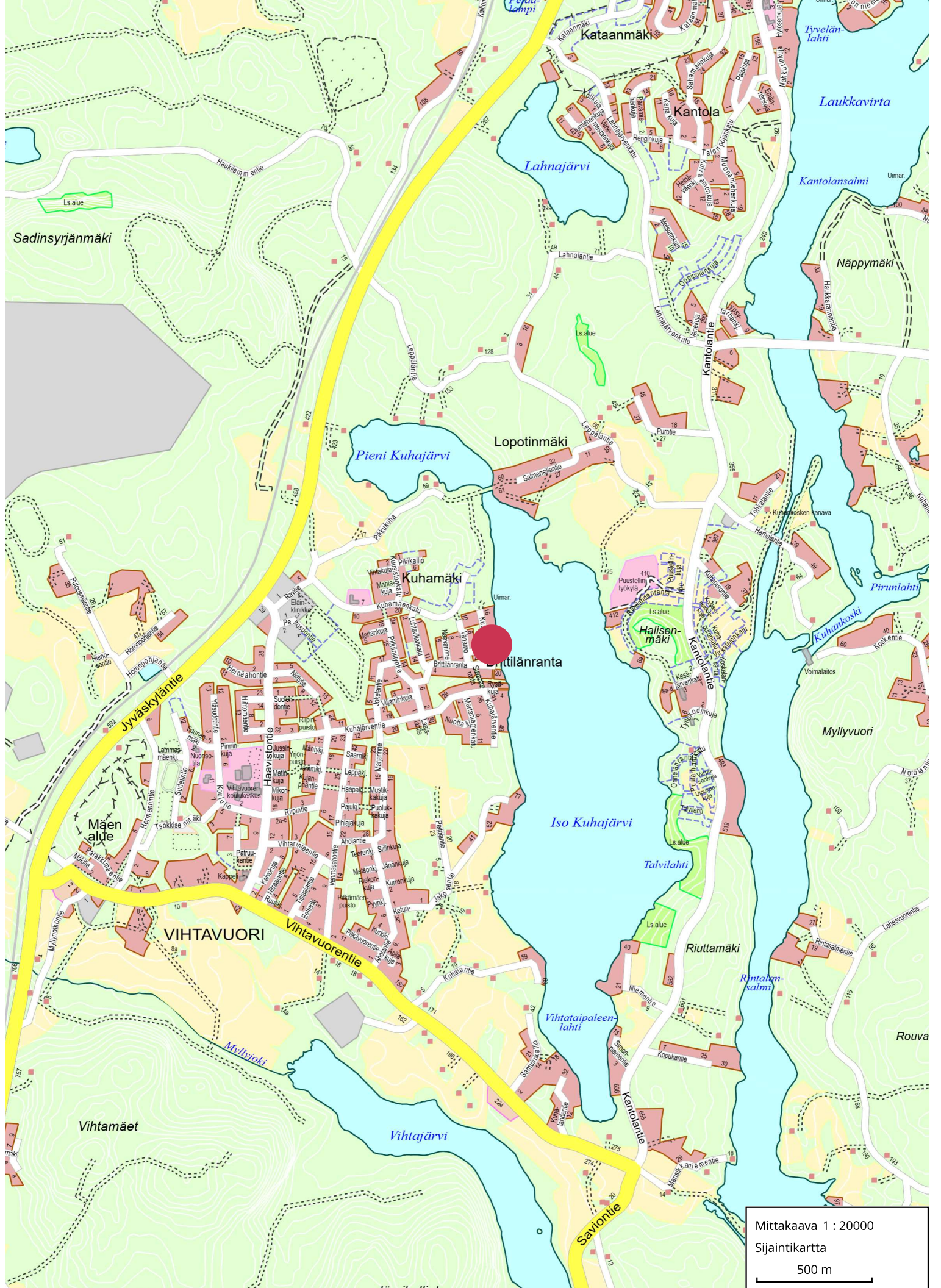
Mittakaava 1 : 20000 Sijaintikartta 500 m